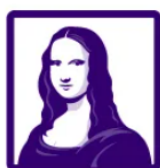
Wyszukiwanie obiektów na obrazach